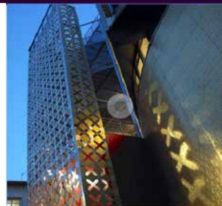
Université Jean Monnet - Site Tréfilerie

12 et 20 avenue de Paris, 42334 Roanne Cedex