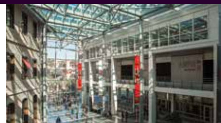
Institut catholique de Lyon