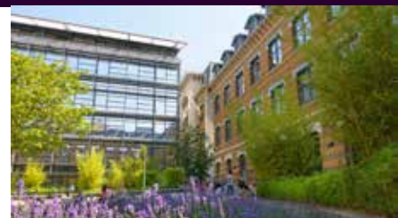
Université Lyon 3 - La Manufacture des Tabacs