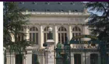
Serge Tanet / Université Lumière Lyon 2